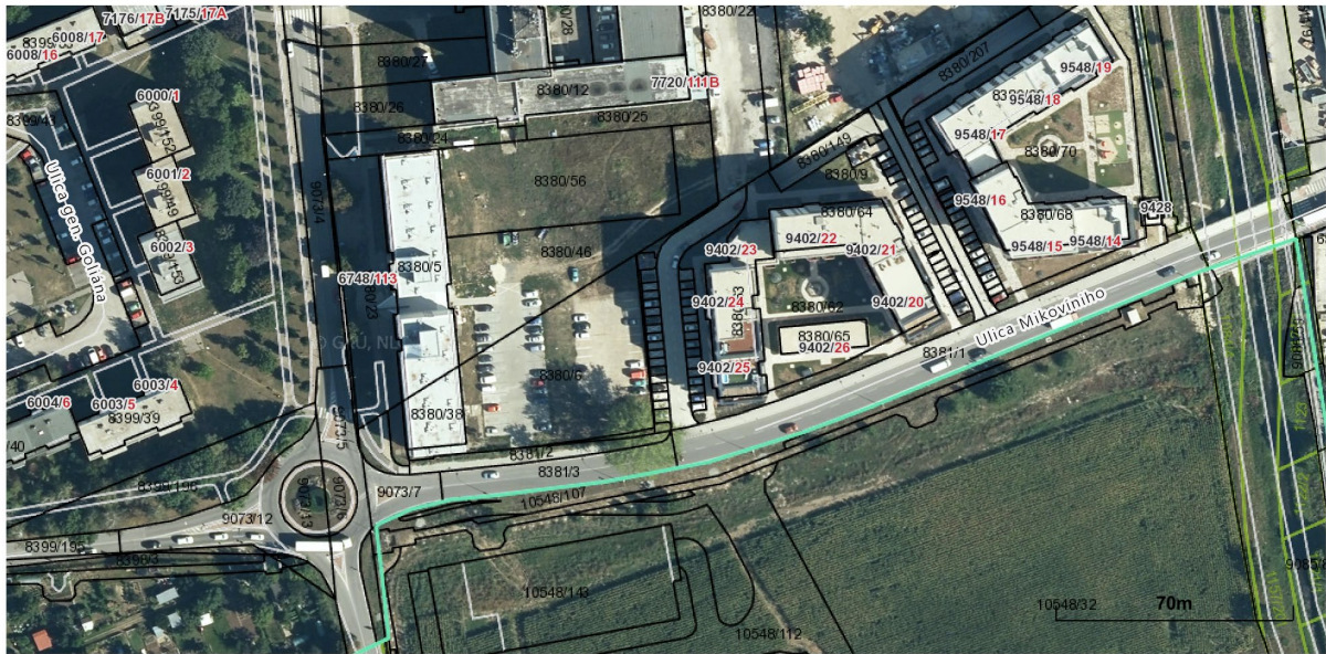
Obrázok 1. katastrálna mapa Trnava, k.ú.: Trnava

Trnavský > Trnava > Trnava > k.ú. Trnava